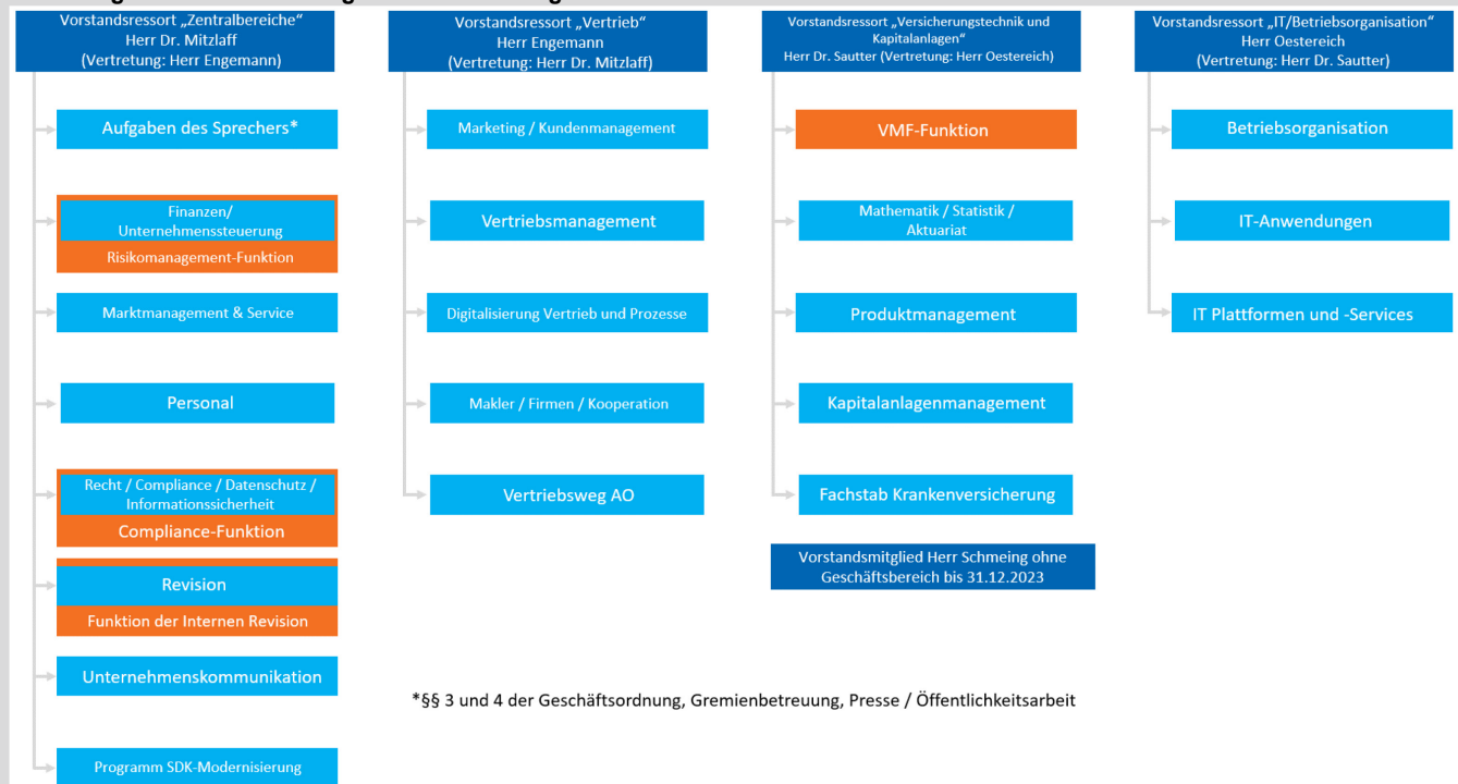
Abbildung 3: Ressortverteilung mit den Zuständigkeiten für die SDK Leben bis zum 31.12.2023